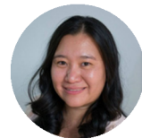
Voorzitter & uitvoerend directeur